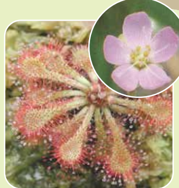
トウカイコモウセンゴケ