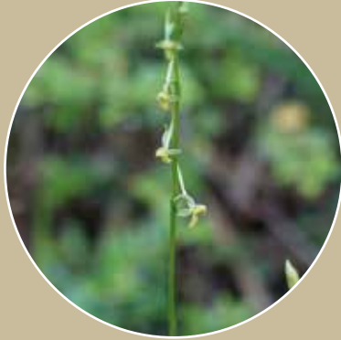
コバノンボソウ(6月)