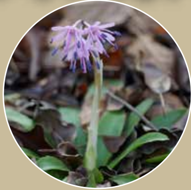
ショウジョウバカマ(3~4月)